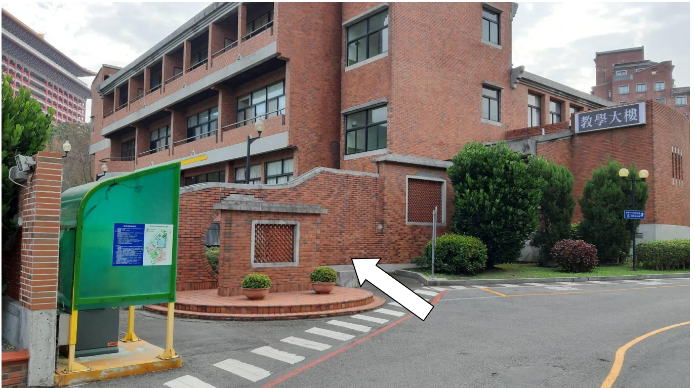
請由此處進入教學大樓 2 樓 328 教室